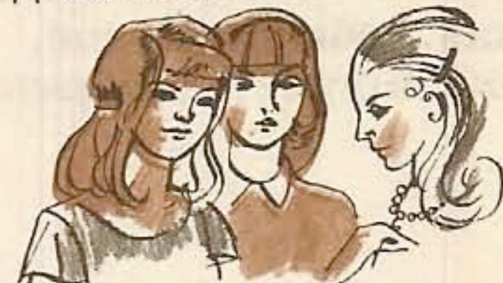
Это девушки. Они подружки.