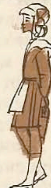
Нина — худенькая девочка.