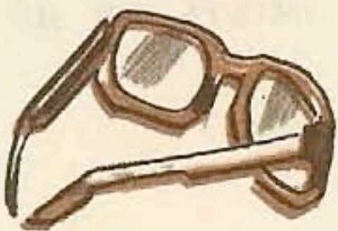
Это очки. Максим в очках.