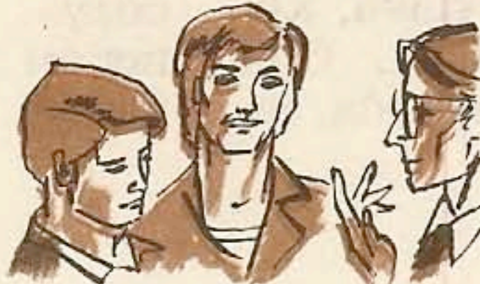
Это молодые люди. Они друзья.